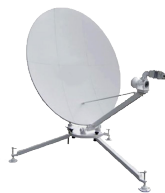
QUICK-DEPLOY/FLY- AWAY ANTENNA